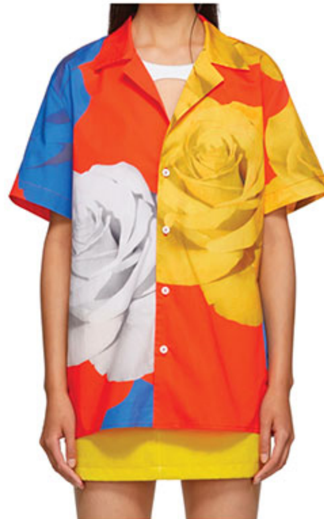
Chemise par Anton Belinskiy chez Ssense

Marché public historique avec une quinzaine de boutiques de créations québécoises.