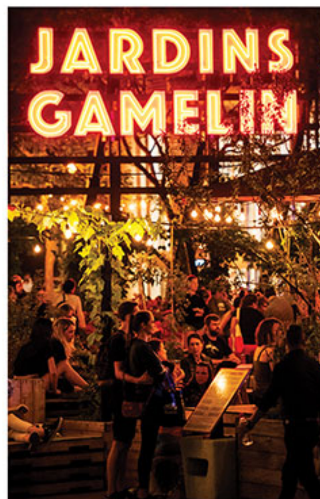
Place Emilie-Gamelin près de la station metro Berri Uqam

Un lieu culturel et festif, proposant des activités quotidiennes pour tous.