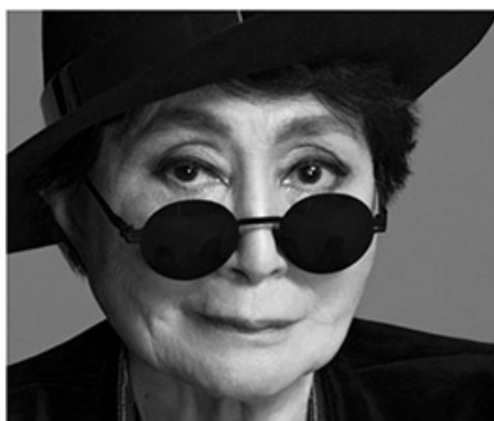
Exposition de Yoko Ono à la fondation Phi

Un immeuble de six étages dans le Quartier des spectacles, abritant plus de vingt galeries d'art ainsi que des ateliers d'artistes et des studios de danse.