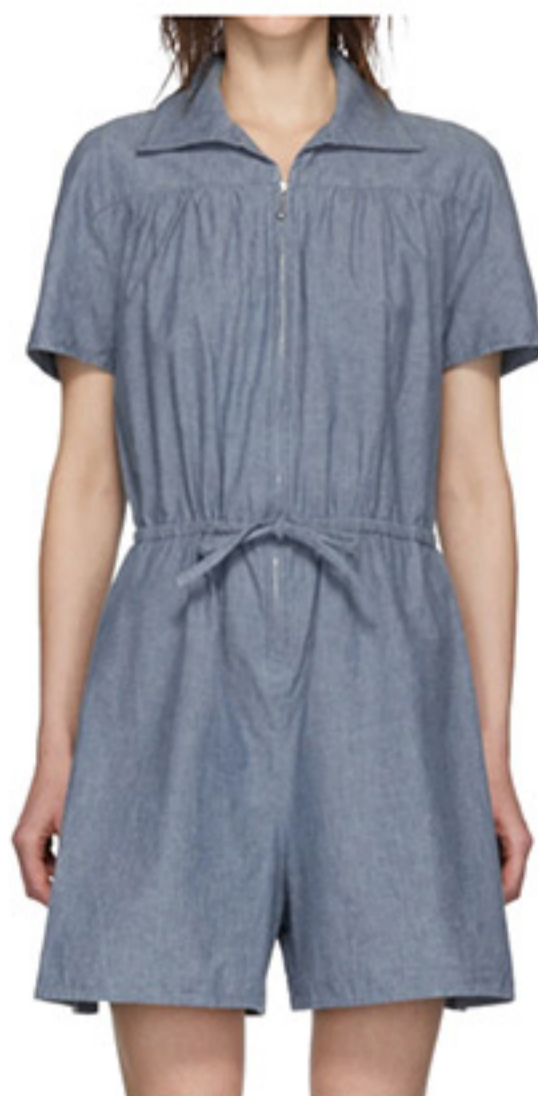
Combinaison Ursula par A.P.C. chez Ssense

Marché public historique avec une quinzaine de boutiques de créations québécoises.